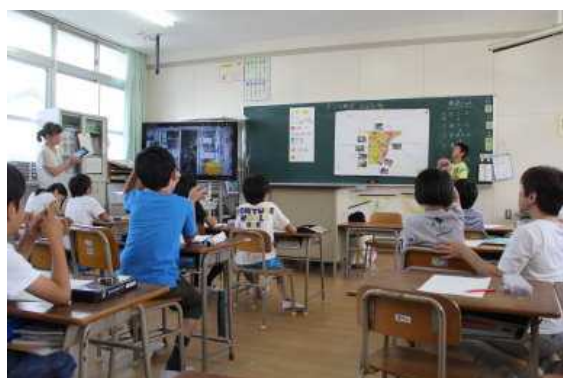
3年 わたしたちの町のようす