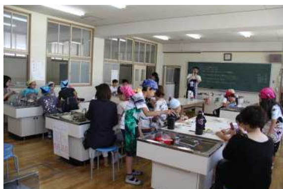
6年 くふうしよう朝の生活