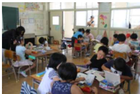
4年 電気のはたらき