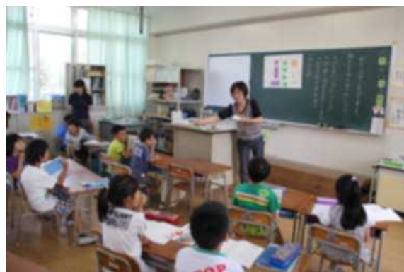
2年 ことばで絵をつたえよう