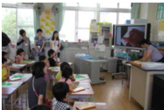
1年 きれいにさいたよ