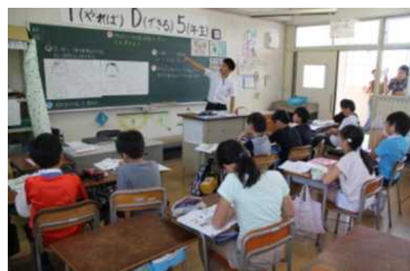
5年 形も大きさも同じ図形を調べよう（5-1）