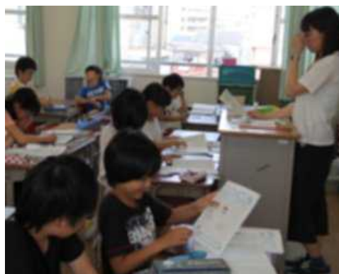
5年 形も大きさも同じ図形を調べよう（習熟度教室）