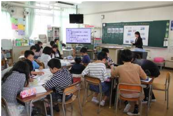
5年 日本の地形と気候