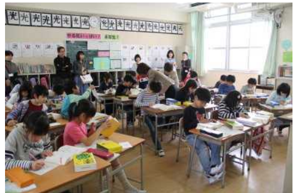
4年 漢字辞典の使い方を知ろう