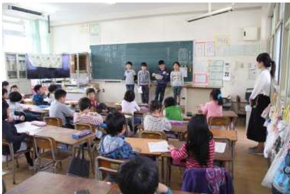
3年 先生をしょうかいしよう