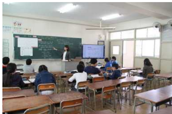
6年 対称な図形（習熟度教室）