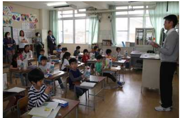
2年 風のゆうびん屋さん