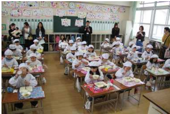
1年 おいしい給食 いただきます！