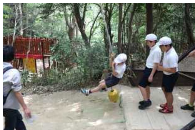
5・6年 須磨離宮公園