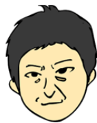
令和8年度 職員構成