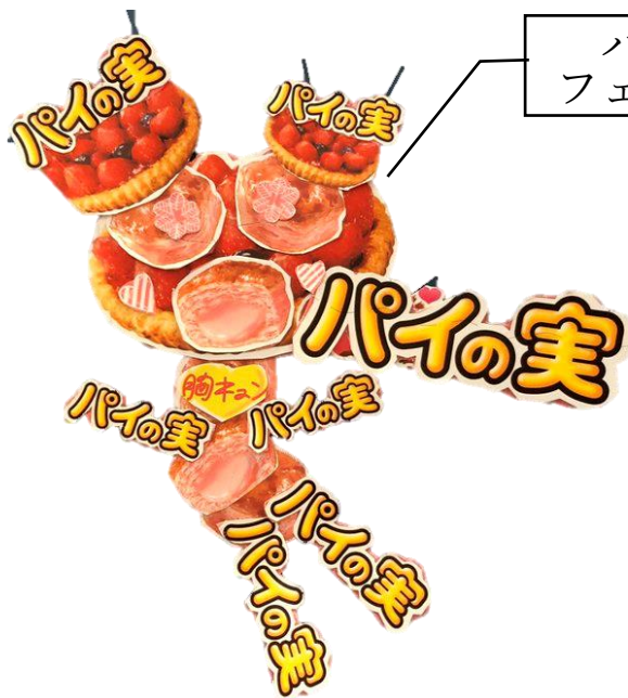
パイの実 フェアリーズ