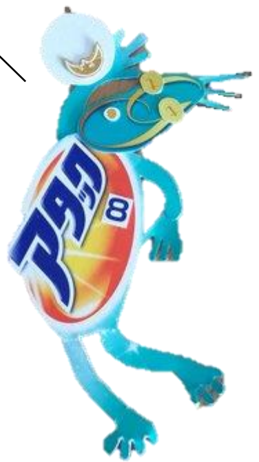
アタック フェアリーズ