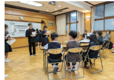
小中民族学級交流会