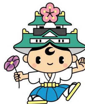
中央区キャラクター 「ゆめまるくん」