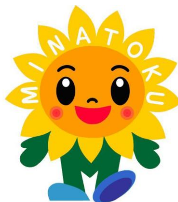
港区キャラクター 「みなりん」

さまざまなスポーツイベントや コンサートも行われている 大阪市中央体育館 なども「港区」だよ！