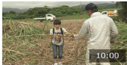
第3回 あたたかい土地と寒い土 地

https://www.nhk.or.jp/syakai/mirai/?das_id=D0005120433_00000