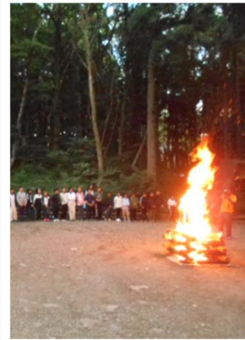
キャンプファイヤー 楽しいチャンツやゲーム、歌を歌って盛り上がりしました。