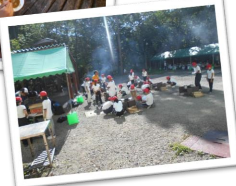
飯ごう炊飯(カレー作り) 調理器具の準備や火おこしも、自分たちでがんばりました。