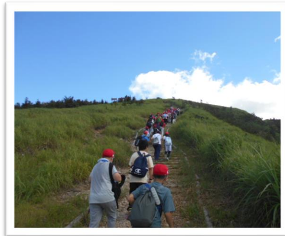
鉢伏山への登山 しんどくても励まし合って、全員が頂上まで登りきることができました。

7月27日(日)～29日(火)の2泊3日、5年生が林間学習でハチ高原へ行ってきました。