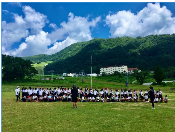
【5年生の記念写真撮影風景です。】