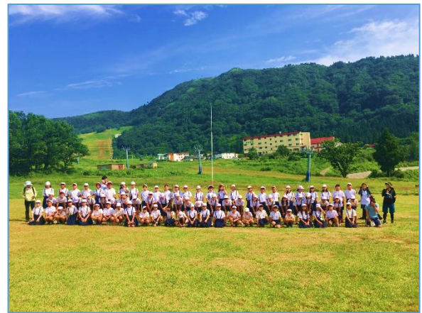
【6年生の記念写真撮影風景です。】