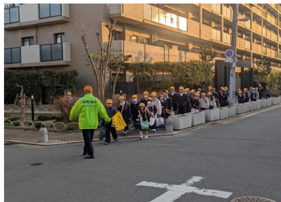
黄帽子をかぶってきれいに並んで歩いています！

当時のことを思い出したくない方もいらっしゃるかもしれませんが、「 体験を語り継ぐ 」ということは大切だと思っています。震災時、私は夜間大学の学生で、昼間は経済団体で働いていました。朝5時46分、背中を突き上げられるような衝撃で目が覚めました。テレビで神戸の街の中継を見たときは言葉を失いました。すぐに着替えて、自転車に乗り、