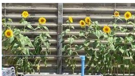
〈たくさん咲いた「はるかのヒマワリ」〉

これから始まる2学期は、自分の夢とか目標に向けて、しっかりめあてを決め、頑張ってもらいたいと思います。でも、「頑張る」とはどういうことなのでしょう？「頑張る」という言葉を、実際にいた子どものことで説明してみます。水泳が苦手な子がいました。その子は15m泳ぐのがやっとでしたが、25m泳げるようになることを目標にします。「絶対できる、頑張るぞ！」と自分を励まし泳ぎました。苦しみながら、あと3m、2m、1mと距離を縮め、目標の25mの壁に手が届きました。周りの子や先生たちは、「よくやった」と思いました。しかし、その子はそこで終わらせず、プールの壁を一蹴りして、折り返したのです。しかも、50mを泳ぎ切りました。びっくりしたところか、感動して涙が出そうになりました。その子が、歯を食いしばって、折り返したことは、すごく値打ちがあります。本当の「頑張る」というのは、こういうことです。目標を達成しても前に向く姿勢、折り返していく姿勢だと、教えられました。自分の夢や目標を達成するには、頑張ることが必要です。そして、「頑張るとは折り返すこと」です。この2学期一つのことでもいいので、頑張ったと言えることをつくりましょう。