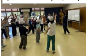
チームビルディング