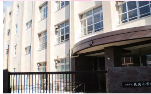
大阪市立長池小学校