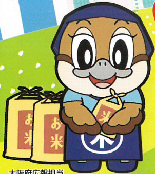
大阪府広報担当 副知事もずやん