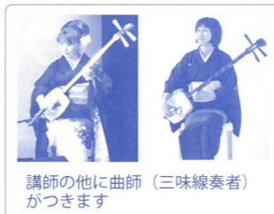
講師の他に曲師(三味線奏者)がきます

選 参加希望理由等(お申込方法を確認) 費 500円 見 可(1名) × 2026/7/3(※)必着(先着順ではありません)