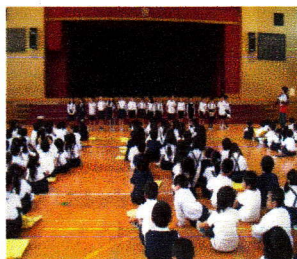
「一二年生と一年生の学校探検」

ています。ムベージュを毎月更新し て一度アクセスしてみ てください。 元気に、仲よく活動 する子どもたちの様子 を写真等で紹介して います。 また、昨年度取り組 んだ研究や今年度の取 り組みについて掲載