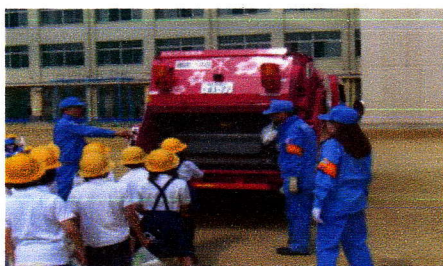
一四年生のゴミ収集体験