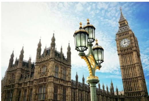
ビッグベン(イギリス)