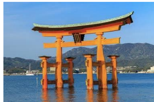
いつくしまじんじゃ 厳 島 神 社 (広島県)