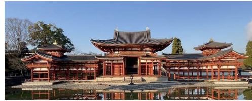
びょうどういんほうおうどう 平 等 院 鳳 凰 堂 (京都府)