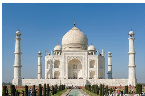
タージ・マハル(インド)