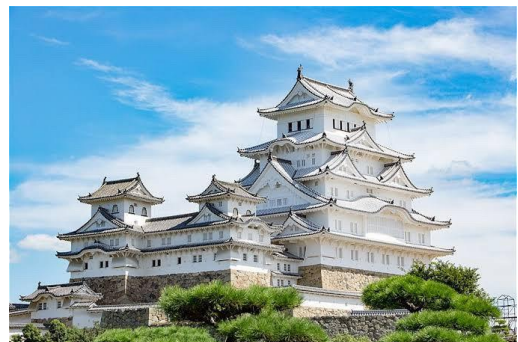
ひめじじょう 姫 路 城 (兵庫県)