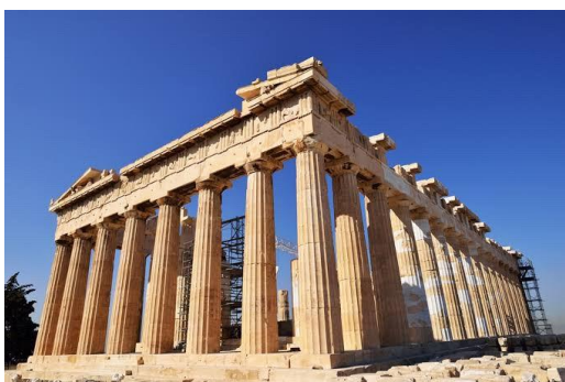
しんでん パルテノン 神 殿 (ギリシャ)