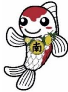
本校のマスコットキャラクター「南(なん)ちゃん」

暖かい春の陽気に包まれて、令和8年度がスタートしました。お子様のご入学・ご進級、誠におめでとうございます。本年度は、1年生 44 名が入学し、全校児童 248 名でのスタートです。