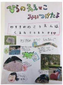
実行委員会 例の作品

編集発行 大阪市立加美小学校 PTA広報委員会 大阪市平野区加美 正覚寺3-13-35