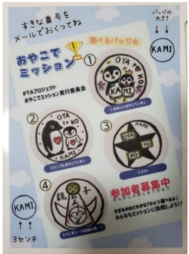
選べる参加賞バッジは 大好評でした!

金賞・銀賞・銅賞を受賞した児童には、賞状を渡しました。賞状も手作りで「この本読んで」「加美ええとこ」でデザインが違います。賞状のお名前は児童と大人の連名です。大切な思い出の一つになれば...と思います。参加賞として手作りのバッジも渡しました。四つのタイプから選べるバッジは加美とペンギンが描かれたバッジです。大事に使っていただけたらと思います。