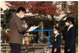
大賞 おめでとう ございます!!