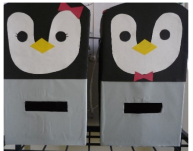
手作りのペンギンポストは とってもかわいい! 児童の人気者です!!

期間中に二十八作品も応募があり、どの作品も児童と大人が一生懸命作り上げた作品ばかりで感動しました。応募作品は玄関に掲示し、投票を行いました。掲示された作品を真剣に見つめる児童の姿を見て、大変嬉しく思いました。児童の投票と実行委員会による採点の総合評価で、大賞・金賞・銀賞・銅賞を選定しました。