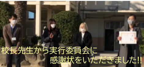
校長先生から実行委員会に 感謝状をいただきました!!

期間中に二十八作品も応募があり、どの作品も児童と大人が一生懸命作り上げた作品ばかりで感動しました。応募作品は玄関に掲示し、投票を行いました。掲示された作品を真剣に見つめる児童の姿を見て、大変嬉しく思いました。児童の投票と実行委員会による採点の総合評価で、大賞・金賞・銀賞・銅賞を選定しました。