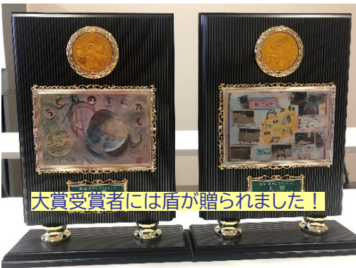
大賞受賞者には盾が贈られました!