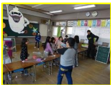
3年「北津守ロケット」