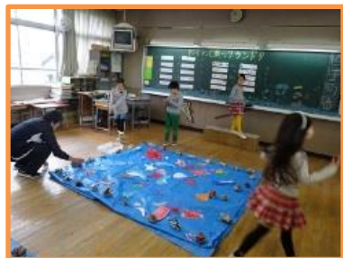
2年「ワクワク魚つりランド」