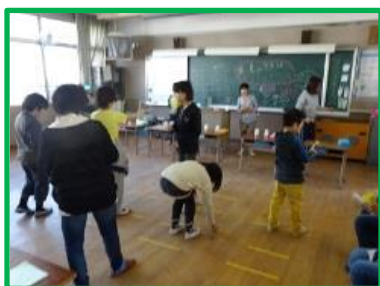
4年「しやてき1位決定戦2016」