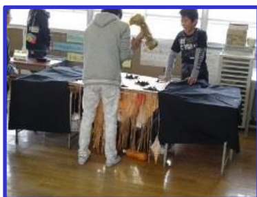
6年「もぐらをたたけ!!」