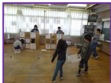
5年「まとをねえストラックアウト」