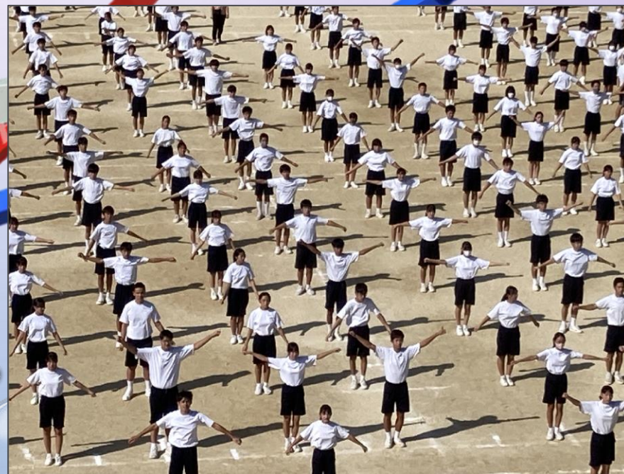
情熱が感動を連れてくる