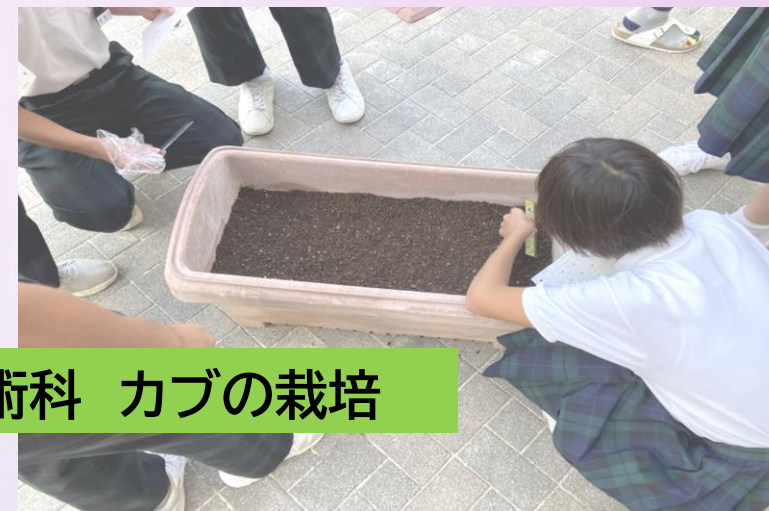
技術科 カブの栽培