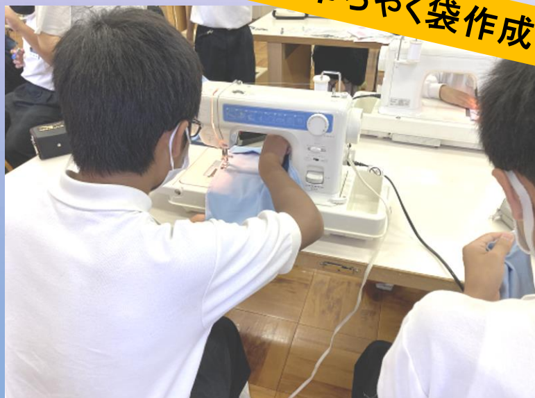
家庭科 巾ちやく袋作成