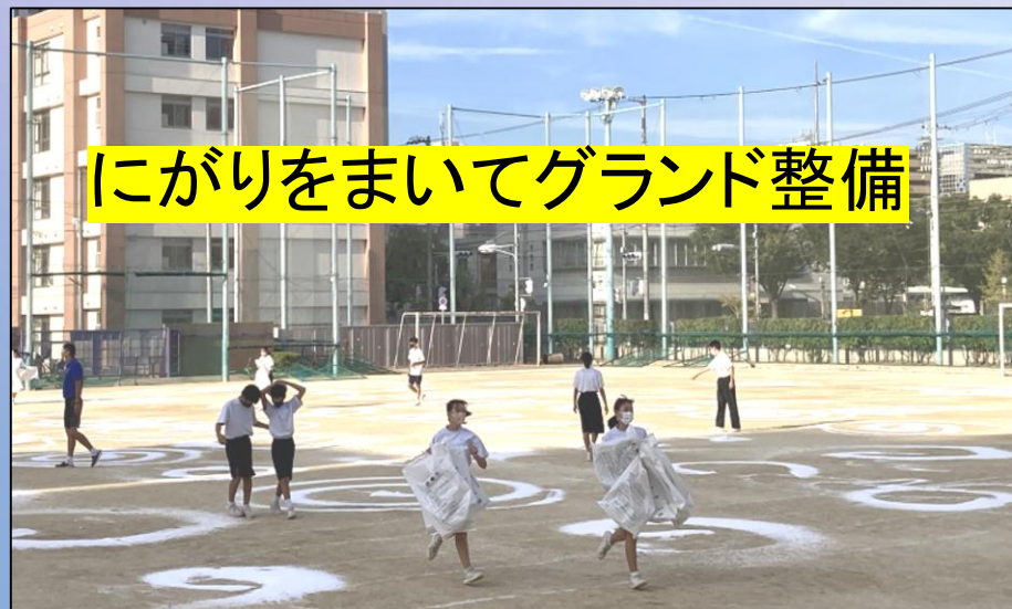
にがりをまいてグラウンド整備