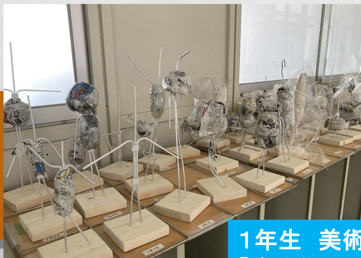
1年生 美術科 「ゆるキャラの作成」

★ 小さな一歩ではあるが、みなさんの行動が 貧困や環境の問題を解決する一歩になる。