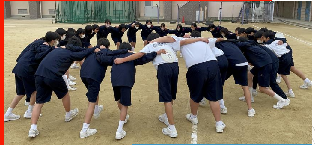
1年生スポーツ大会

一番楽しかったのは、他愛もない日常です。たしかに体育大会などは一発のインパクトは大きいですが、ちりも積もれば山となるというように、他愛もない日常をすべて足すと勝てないと思います。そんな他愛もない日常を彩ってくれたのは友達や家族や先生達です。本当に感謝しています。