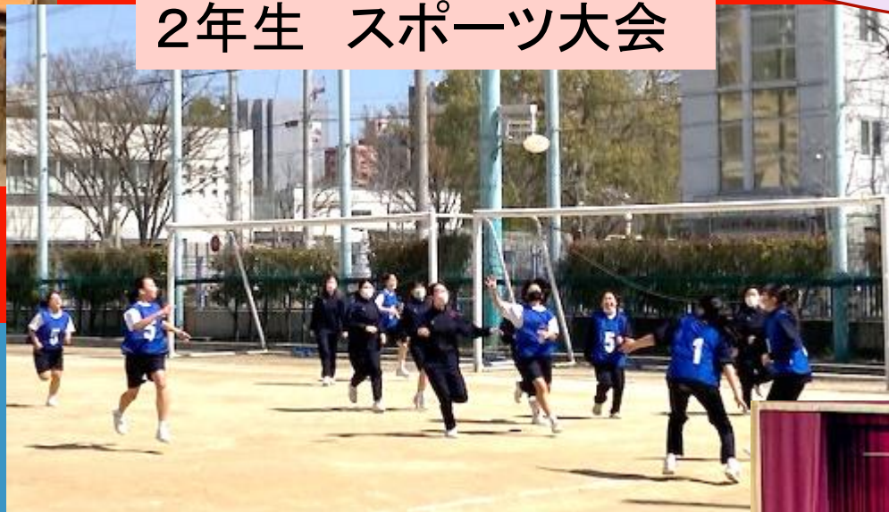
2年生 スポーツ大会