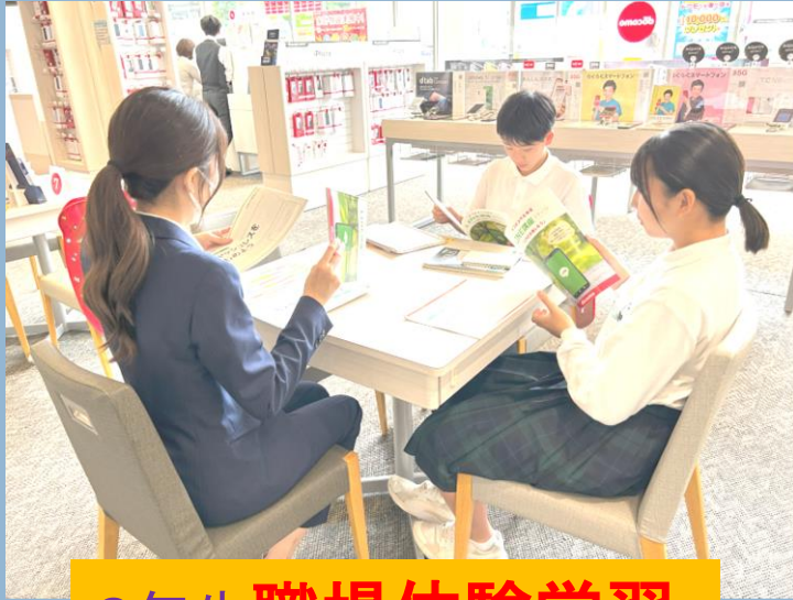
2年生職場体験学習 地域の皆さま方にご協力いただきました。