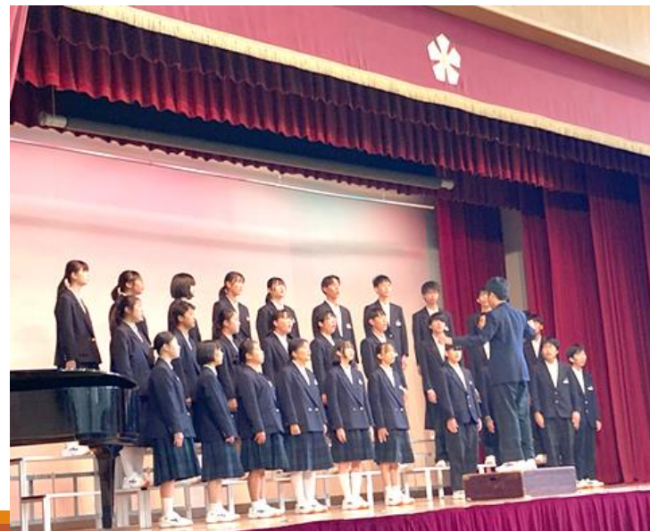
2年生合唱コンクール 金賞2組 時の旅人