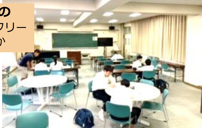
1年生 C-NETとの英語の授業