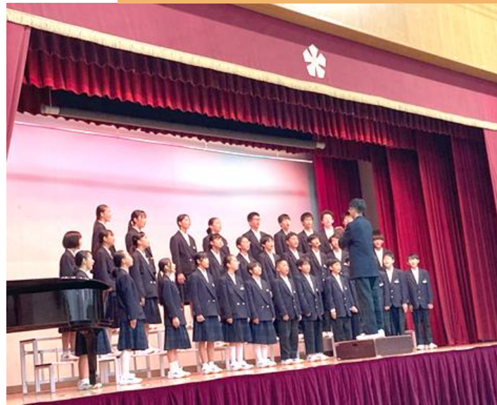
1年生合唱コンクール 金賞4組 マイバラード