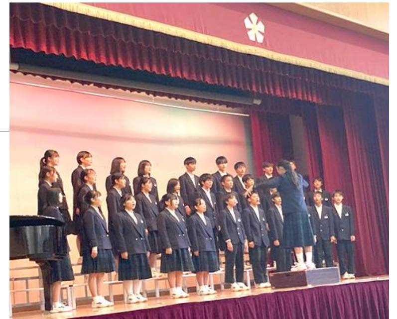
3年生合唱コンクール 金賞4組 COSMOS