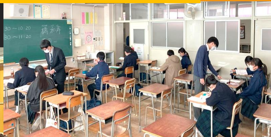
3年生 ブラッシュアップ学習会