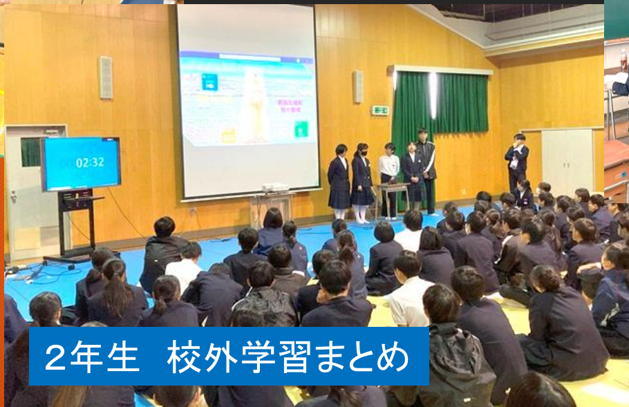
2年生 校外学習まとめ