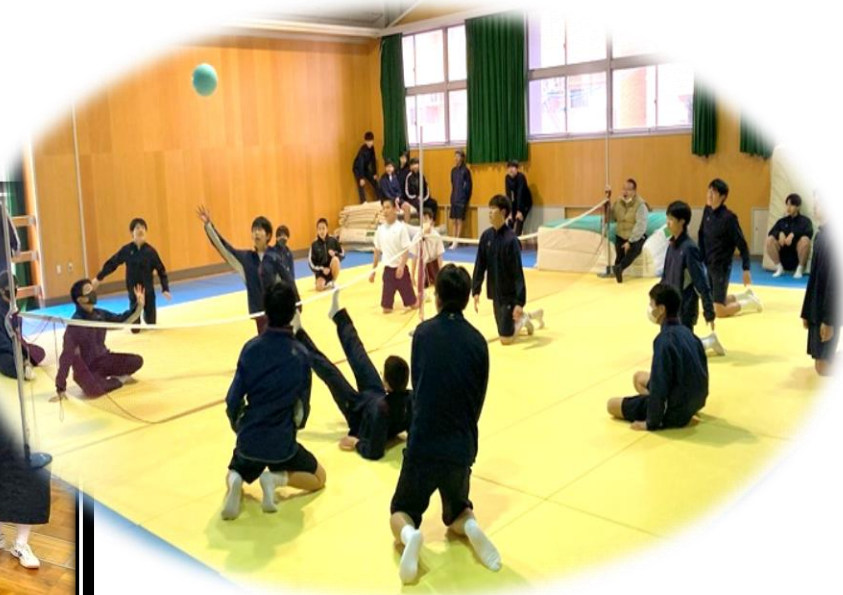
3年生 保健体育 「シッティングバレー」