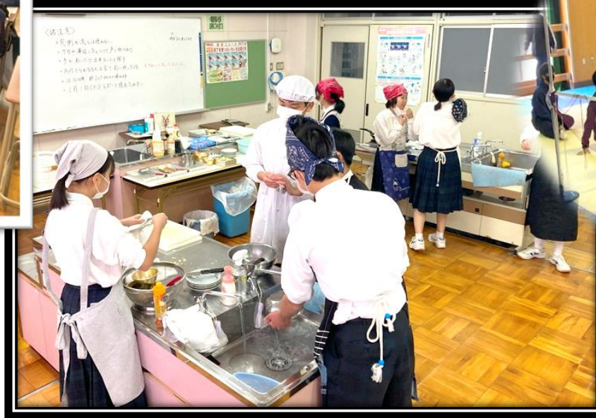
2年生家庭科 調理実習 「餃子とポップコーン作り」