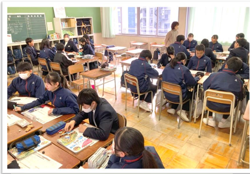
1年生社会科 グループワーク 「持続可能な社会の実現」