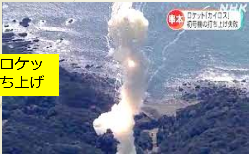
民間ロケット 打ち上げ