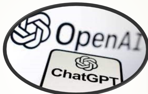
急速なデジタル化