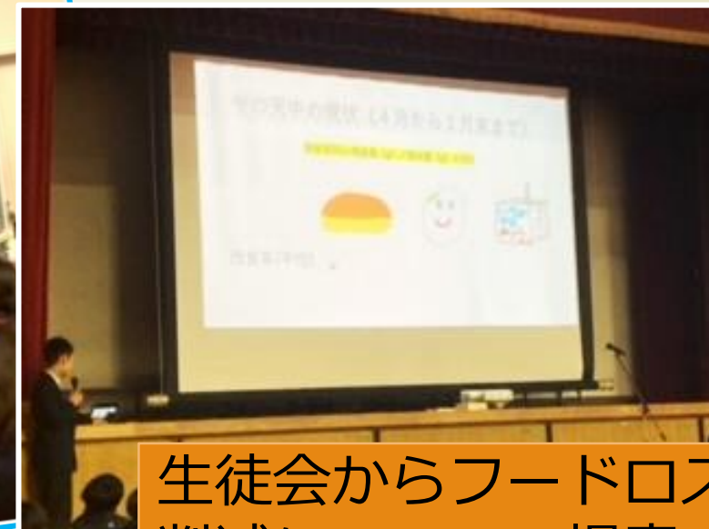
生徒会からフードロス削減についての提案