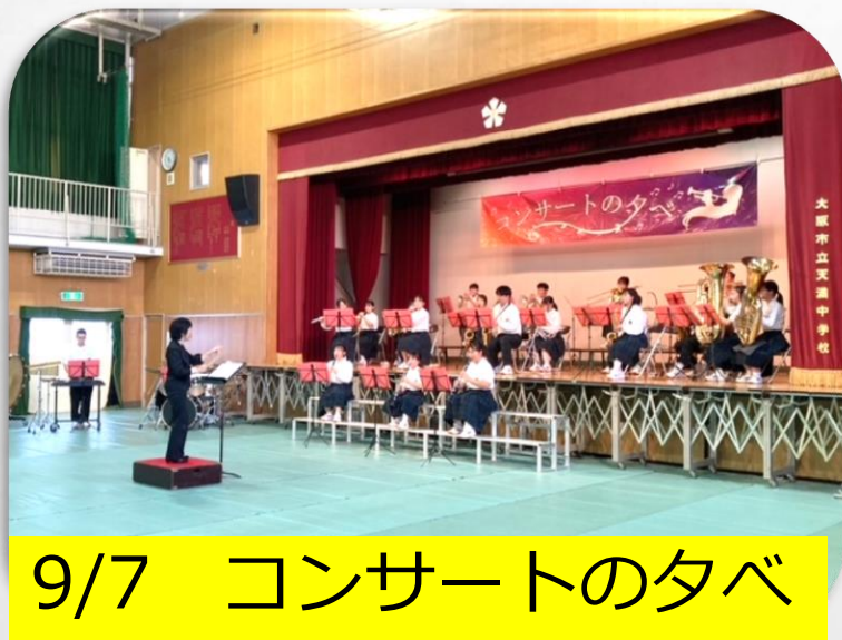
9/7 コンサートの夕べ