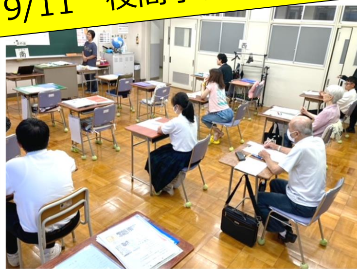
9/11 夜間学級との交流