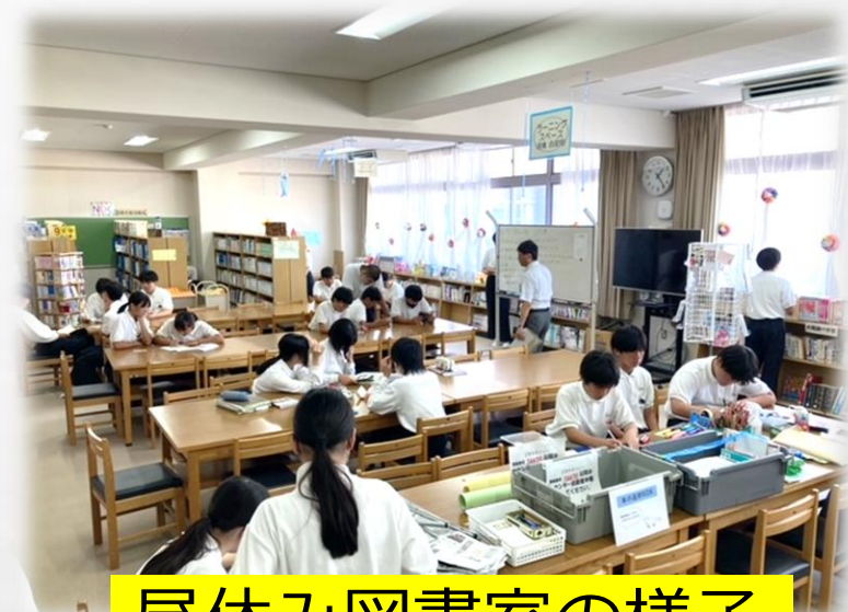
昼休み図書室の様子