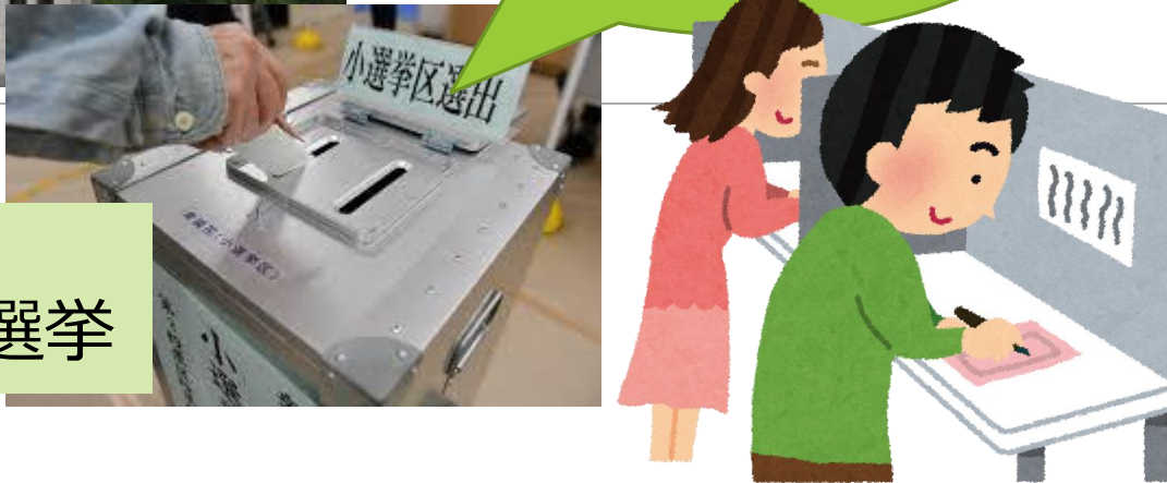
大阪市でおこなわれる選挙