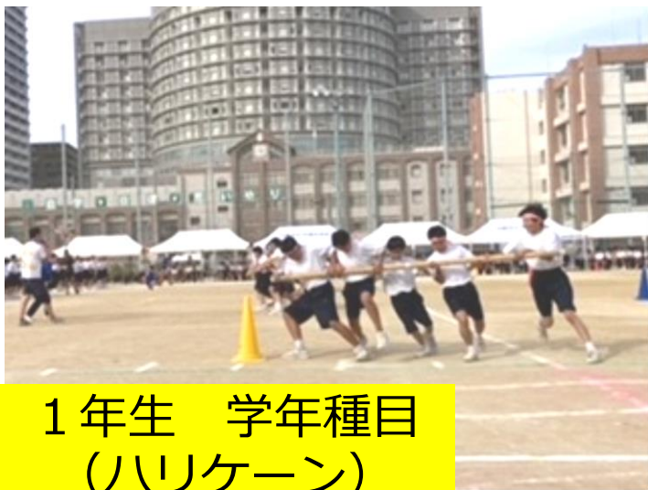
1年生 学年種目 (ハリケーン)

絶好の体育大会日和のもと、たくさんのご来賓・保護者の皆様のご来場いただきました。ありがとうございました。