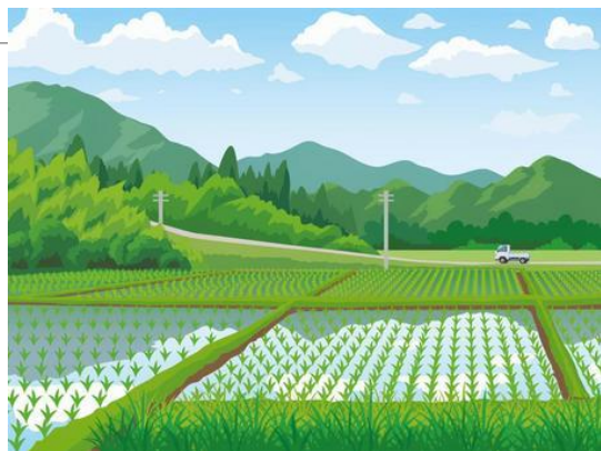
春～秋：養分を蓄える