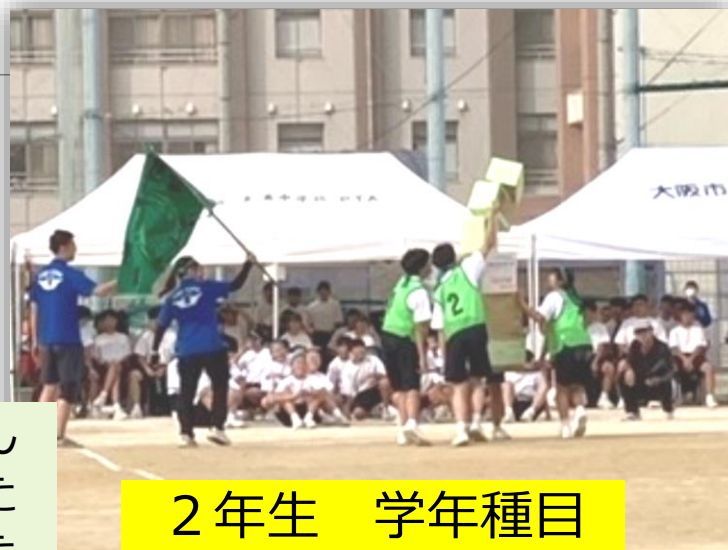
2年生 学年種目 (宅配便リレー)