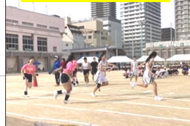
3年生 学年種目 (シャイニングスマイル)