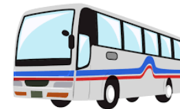
5/27～29 3年生 修学旅行 北陸方面