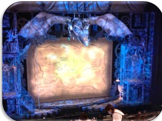
5/23 2年生 芸術鑑賞 劇団四季「ウィキッド」