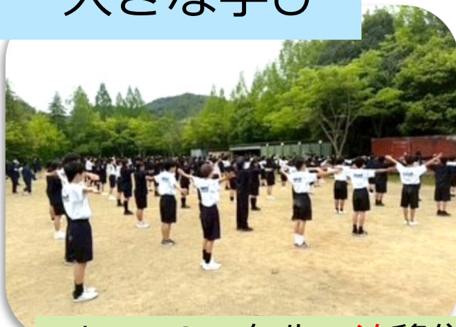
5/15,16 1年生一泊移住 大阪府立少年自然の家