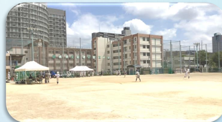
野球部 新チーム始動