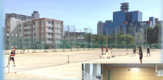
テニス部 暑さも打ち返す