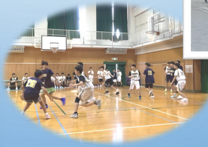
バスケットボール部 粘り強いデフェンス