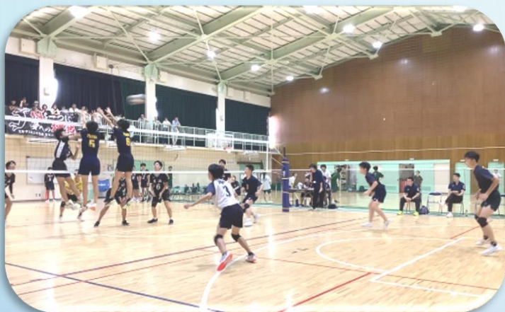
バレーボール部 チーム一丸