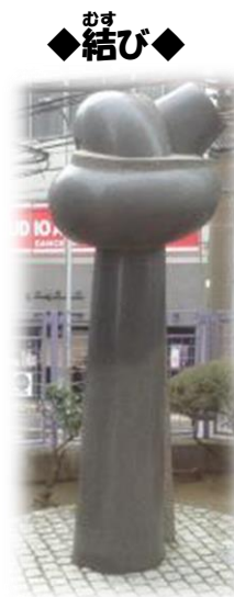
きゅうかんなんちゅう きゅうおうぎまちゅう 旧 菅南中と旧 扇町中、 ひる よる むす 昼と夜を結ぶモニュメント

◎ かつどう クラブ活動 ねんど 【2025年度】 こくさい 国際クラブ ( みんぞく 民族クラブ )、 すうがく 数楽クラブ、 しやうどう 書道部、 しゅげい 手芸クラブ、パソコンクラブ