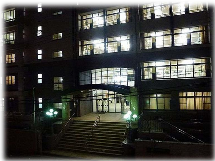
◆ てん まちゅうがっこう 天満中学校 せいもん 正門 ◆