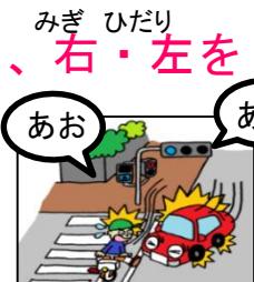
子供関連事故件数 (H26～H28計上)

大阪府下でH26～28年中発生した 子供(15歳以下かつ中学生以下)が 関連した事故を計上