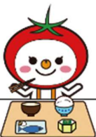
大阪市食育推進キャラクター

これらを摂りすぎると、生活習慣病を引き起こすリスクが高まります。中学生の時期に健康に良い食習慣を身に付けることは、生活習慣病を予防し、生涯を通して健康で豊かな生活を送ることにつながります。健康を支える3本の柱である「栄養のバランスの良い食事」「適度な運動」「十分な休養」を心がけましょう。