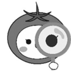
大阪市食育推進キャラクター「たべやん」