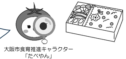
大阪市食育推進キャラクター「たべやん」