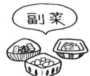
野菜・いも類・きのこ・海 そうなどを使ったおかず