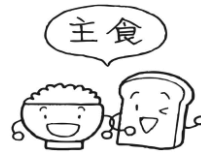
ごはん・パン めん類など

炭水化物、脂質、たんぱく質、無機質（カルシウムや鉄など）、ビタミンなどの栄養素をバランスよくとることで、健康を維持し丈夫な体づくりができます。