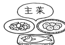
魚・肉・卵・豆・豆製品 などを使ったおかず