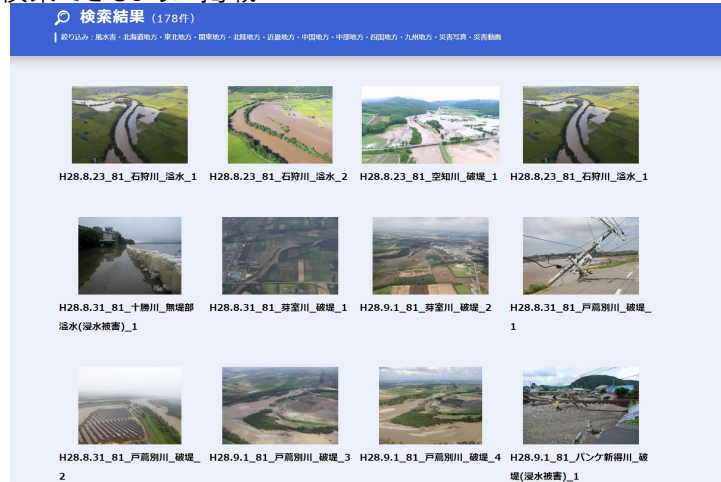
充実したデータ(写真・動画)