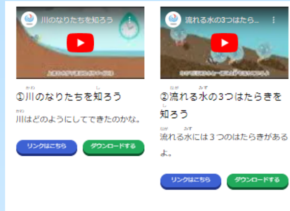
分かりやすい紹介文 「流れる水の働きと土地の変化について学ぼう」