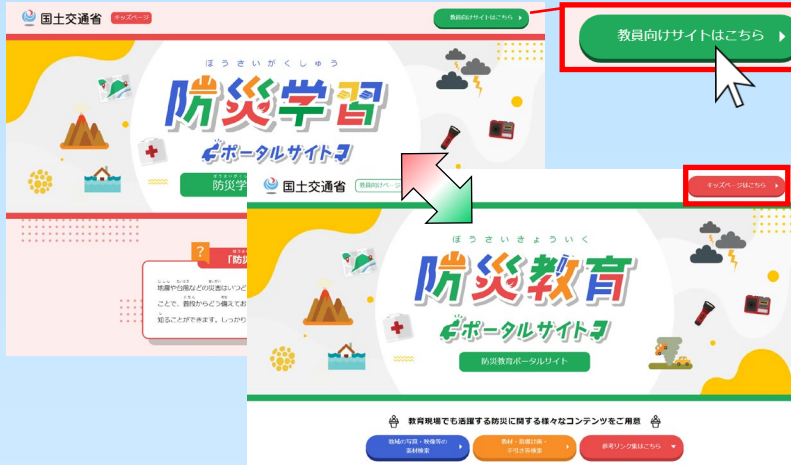
子ども向けページと教員向けページ