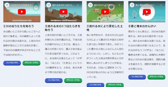
テーマごとに4分割した短時間動画