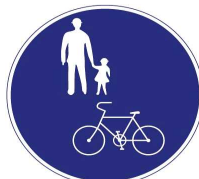
自転車歩道通行可