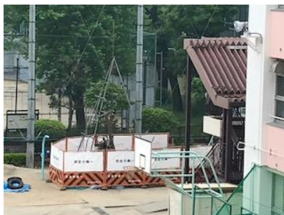
(GW明けから始まったボーリング調査)

現在、西区内でマンション等の建設が進み、転入による人口が増加し続けています。花乃井中学校でも今後入学してくる生徒の増加とそれに伴う学級の増加を見越して、令和5年3月完成を目指して新校舎の建設準備が進んでいます。