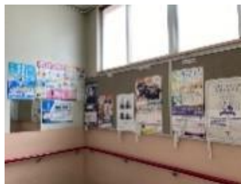
《各高等学校のポスター》

実施できる機会も増えるのではないのでしょうか。3年生の皆さん、悔いのない進路選択するには、しっかり情報を集めて、お家の方をはじめたくさんの方に相談することですよ。