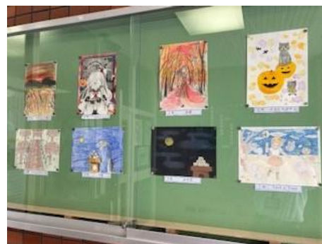
《玄関掲示に紅葉やハロウィン》

本日中間テストが終わりました。前1週間が文化祭週間で勉強をする時間があまりなかったのではないのでしょうか。文化祭は素晴らしいものになりましたが、テストはよくなかったでは本末転倒です。まさに文武両道を迫られたこの1週間でした。また、9月30日には英語検定も実施されました。2年生は全員受検(1・3年生は希望者のみ)しましたが、これも5級から2級まで、それぞれの希望に合わせての受検となりました。結果が楽しみです。