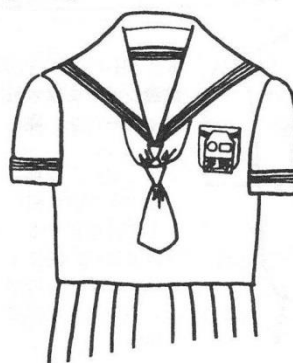
セーラー服 ・色 白