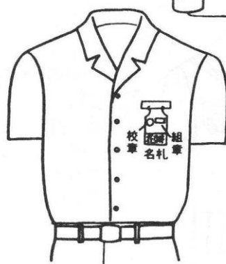
開襟シャツ又は半袖