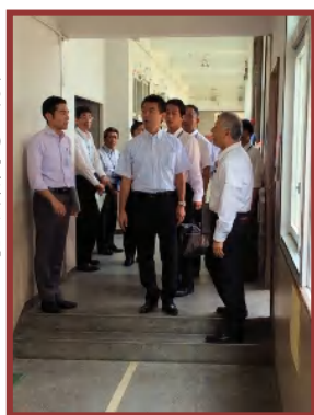
廊下の段差を説明

室だったところを普通教室にしたために、他の教室と黒板の位置が逆だったり、廊下側に窓がなかったり今年の春休みに窓は設置済みなどを説明するとともに、3階から運動場を見ていただき、運動場に斜めに引いた50mラインを見ていただきました。運動能力テストで50m走をしてもゴールと同時に壁に当たってしまうほどであることも説明しました。北館から通用門前を通って、本館3階の図書室を見ていただきました。期末テスト前で、元氣アップ事業のテスト前学習会に参加していた生徒たちのあいさつを受けておられました。地域のボランティアの方々の協力で、図書室は毎日開館できていること、テスト前の学習会で図書室を利用する回数が増えていることなどの説明をしました。ボランティアの方は卒業生で、自分