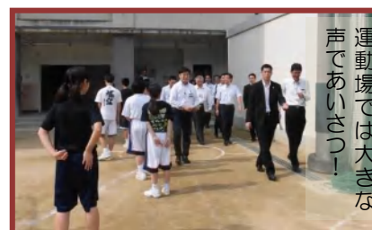
運動場では大きな声であいさつ！