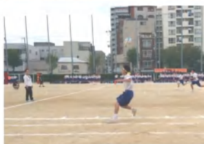
2年ワンオールリレー