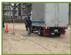
左折する車に巻き込まれる様子