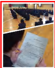
受験前の学年集会

かどうかが、考えてみてくだい。新たな学年で充実した生活を送るためには、見直しの時期が必要です。