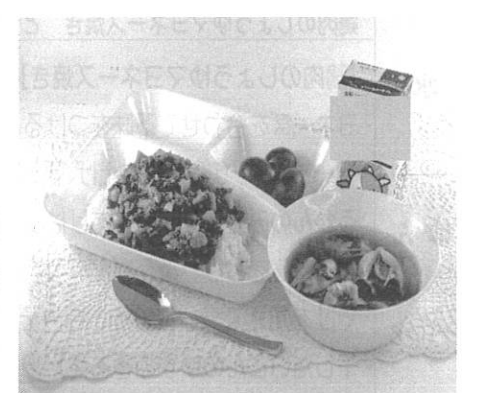
優秀賞 吉野小学校 5年2組給食委員会