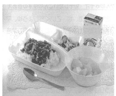
優秀賞 野田小学校 ザ・野田チーム